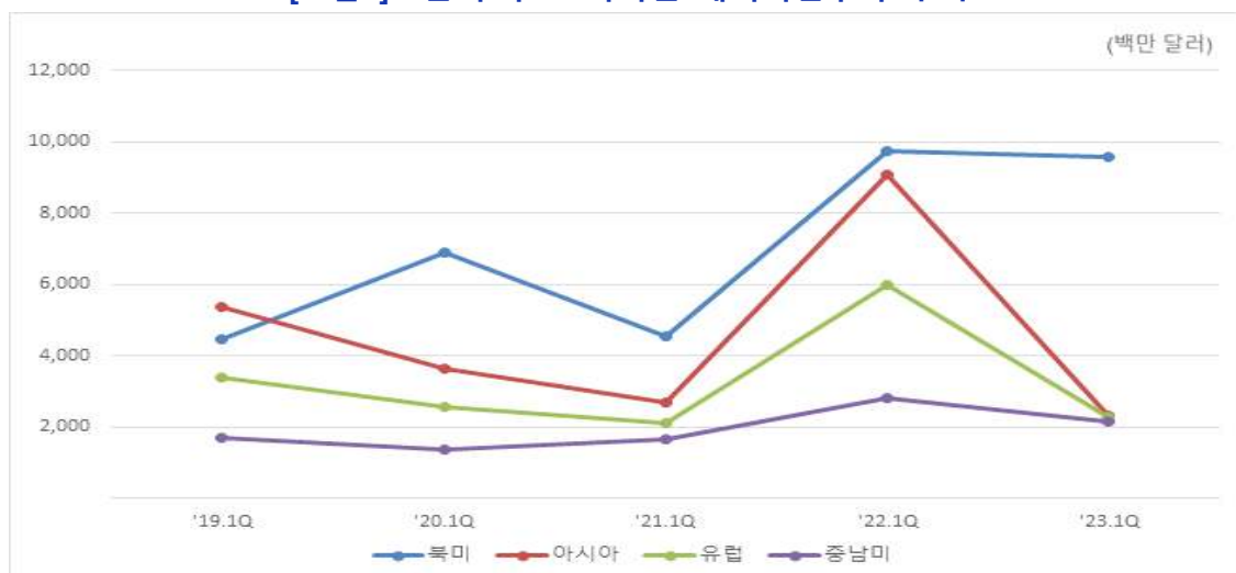
[그림2] 1분기 주요 지역별 해외직접투자 추이