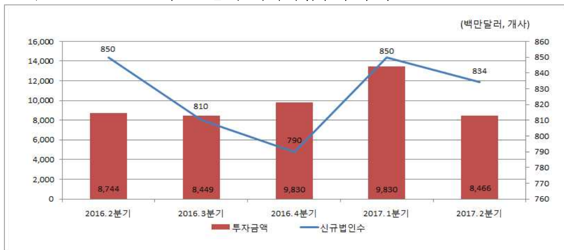
최근 5분기 해외직접투자 추이